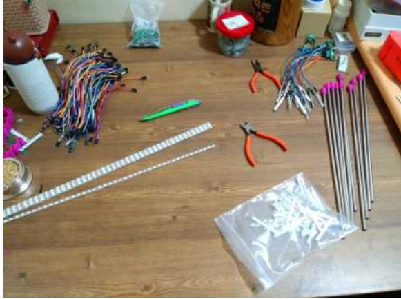
그림 3 USB수경화분 부품을 준비하는 모습